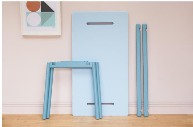
table et de banc qui doit pouvoir résister aux égratignures et aux accidents quotidiens d'une vie bien remplie ».

Conçue pour la vie urbaine actuelle, où la mobilité est de mise, d'où son nom « Nomad », et où l'espace est précieux, cet ensemble se démonte complètement pour reconfigurer l'espace et est facile à stocker et à transporter.