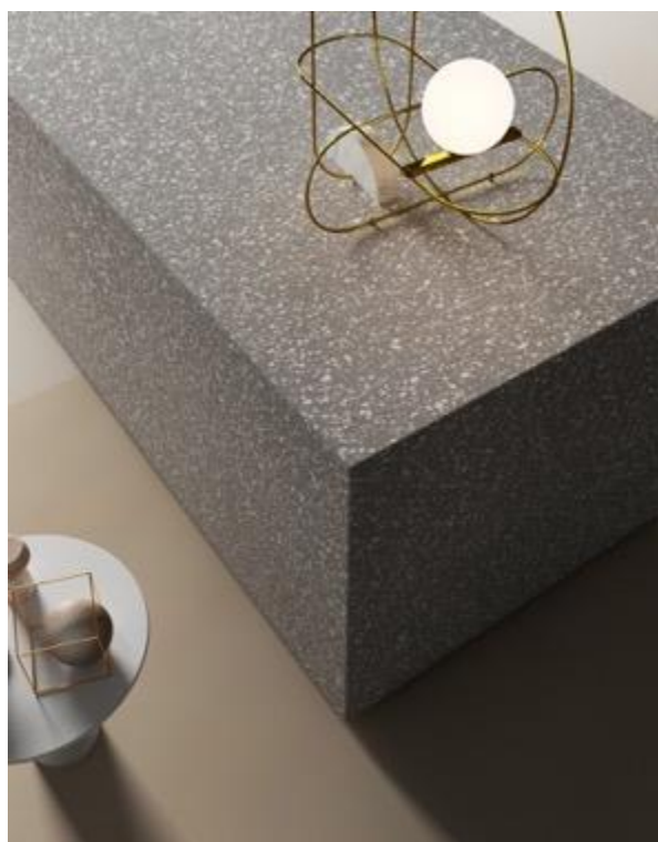
HI-MACS® TERRAZZO GRIGIO