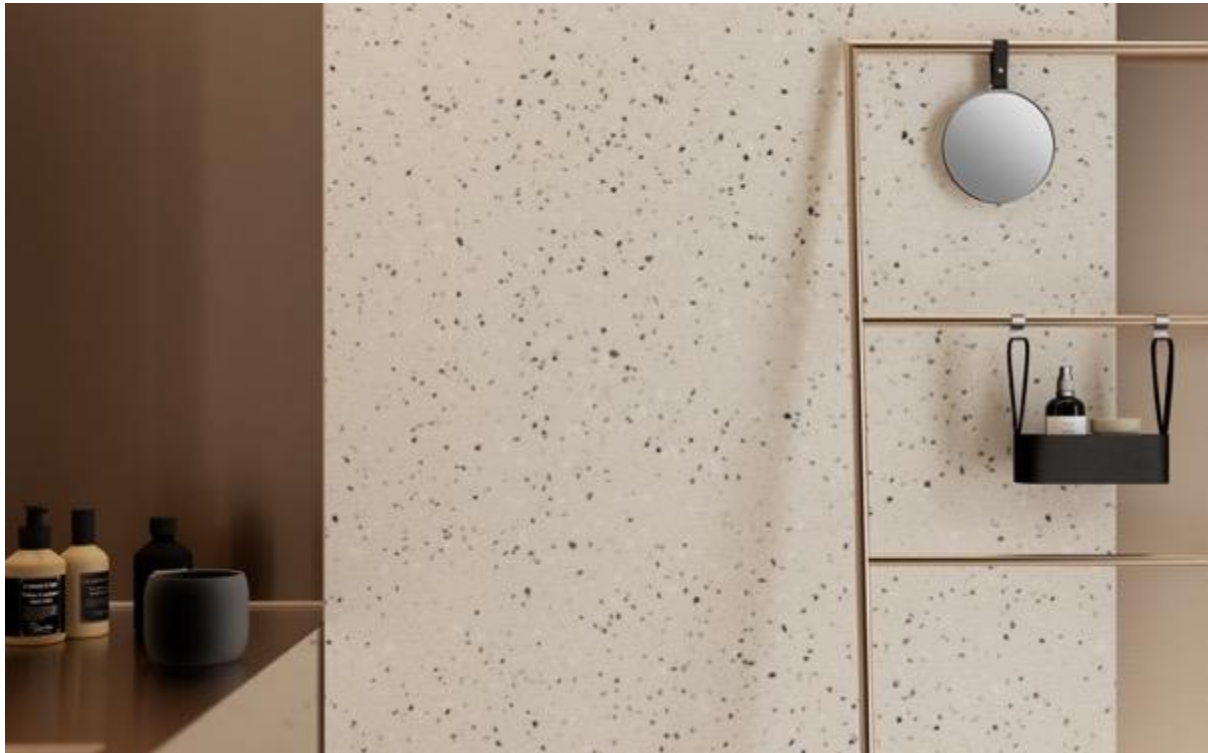
HI-MACS® TERRAZZO CLASSICO