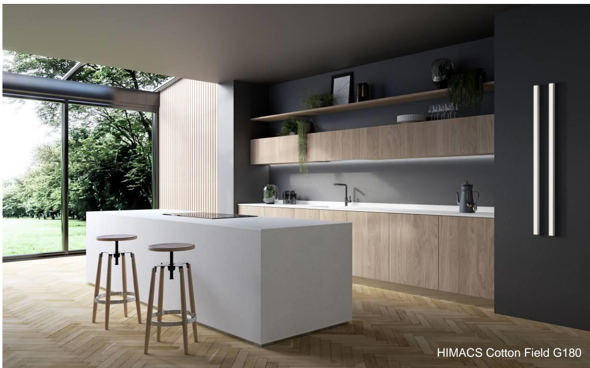
HIMACS Cotton Field G180

Die Verwendung von HIMACS bietet zahlreiche zusätzliche Vorteile: Der Mineralwerkstoff ist mit keinen VOC-Emissionen verbunden und frei von Formaldehyd und Nanopartikeln. Das Ergebnis ist eine nahtlos verbundene feste Oberfläche, die jedes Projekt zu etwas ganz Besonderem macht.