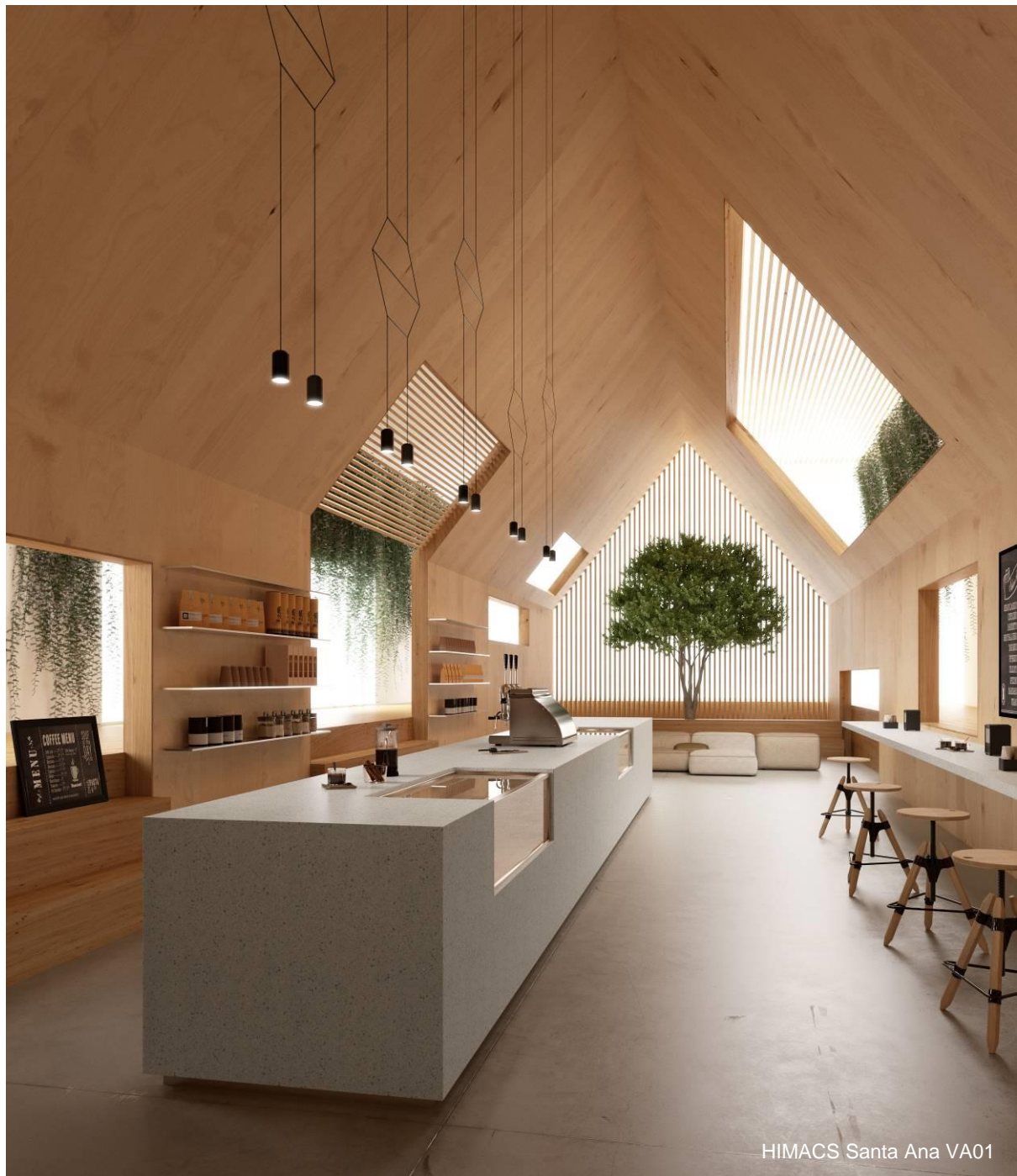
HIMACS Santa Ana VA01