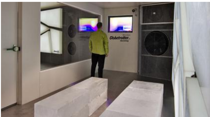
Die Transluzenz und Farblichkeit des Materials HI-MACS® waren ausschlaggebende Argumente für die Entscheidung der Architekten für den Mineralwerkstoff.