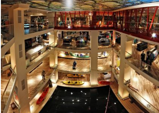
Die Globetrotter-Filiale in München bietet alles, was das Outdoor-Herz begehrt.