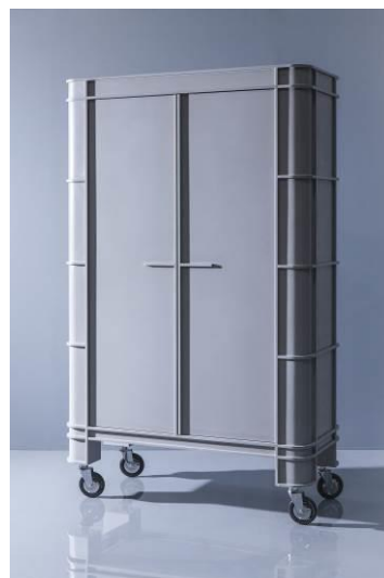
Grey on Gray by Visser & Meijwaard

Pour plus d'informations rendez-vous sur www.himacs.eu