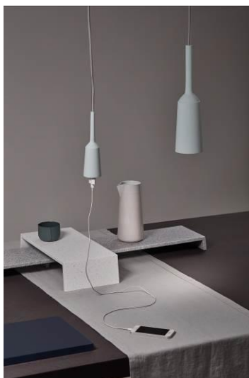
Landscape Tables by Lotte Douwens