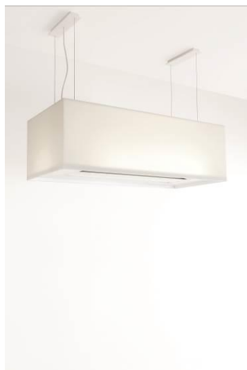
Zen by Novy

Enfin, pour Dutch Satellite, le studio Lotte Douwens a réalisé « Table Landscapes », un système de plateaux conçus pour se superposer et s'entrecroiser sur la table, créant ainsi un enchevêtrement de plans dynamiques et très colorés.