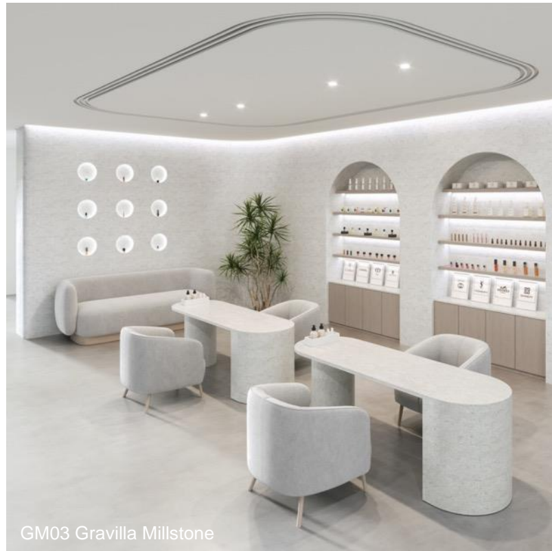
GM03 Gravilla Millstone

Gravilla Millstone allie une texture de couleur neutre à des teintes grises peu chromatiques, pour un aspect léger et lumineux, idéal pour les espaces manquant de lumière naturelle ou pour rehausser une palette plus sombre. Il convient particulièrement bien aux magasins et aux locaux professionnels grâce à son aspect frais et moderne qui confère une touche luxueuse à tout intérieur.