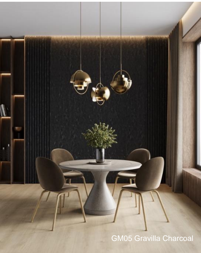
GM05 Gravilla Charcoal

Gravilla Charcoal apporte de la profondeur et une remarquable finition aux projets résidentiels ainsi qu'au secteur de l'hôtellerie et aux spas. Moderne et sophistiqué, son aspect raffiné et luxueux fusionne les tons anthracite et noir pour captiver et enchâter. Il est associé à des accents métalliques en or brossé ou en laiton brun.