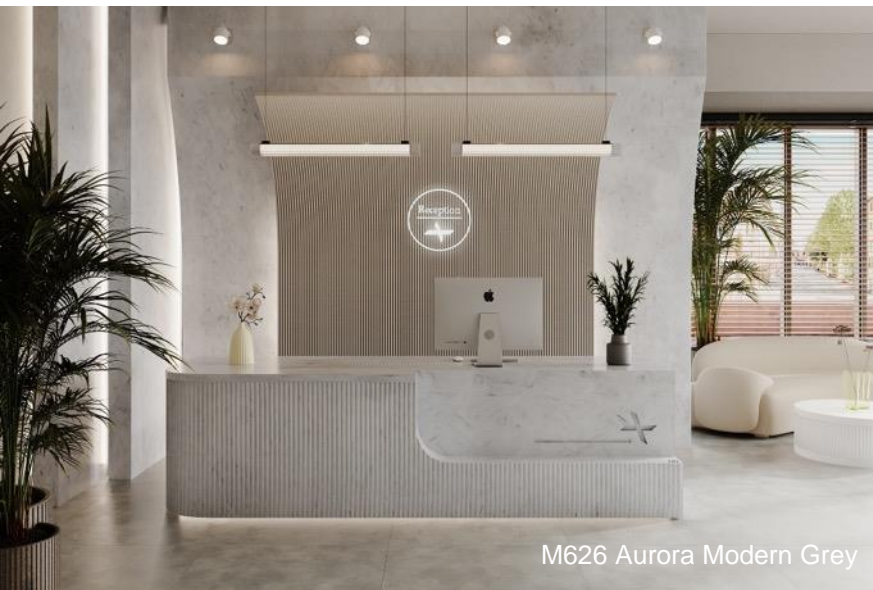
M626 Aurora Modern Grey

Aurora Modern Grey est élégant et moderne avec son esthétique contemporaine qui lui permet de compléter divers styles de conception et des accents de couleurs froides ou audacieuses. Avec une toile de fond parfaitement neutre, cette teinte polyvalente apporte sophistication et élégance aux espaces de vente, au secteur de l'hôtellerie et de la restauration, ainsi qu'aux entreprises et aux locaux commerciaux.