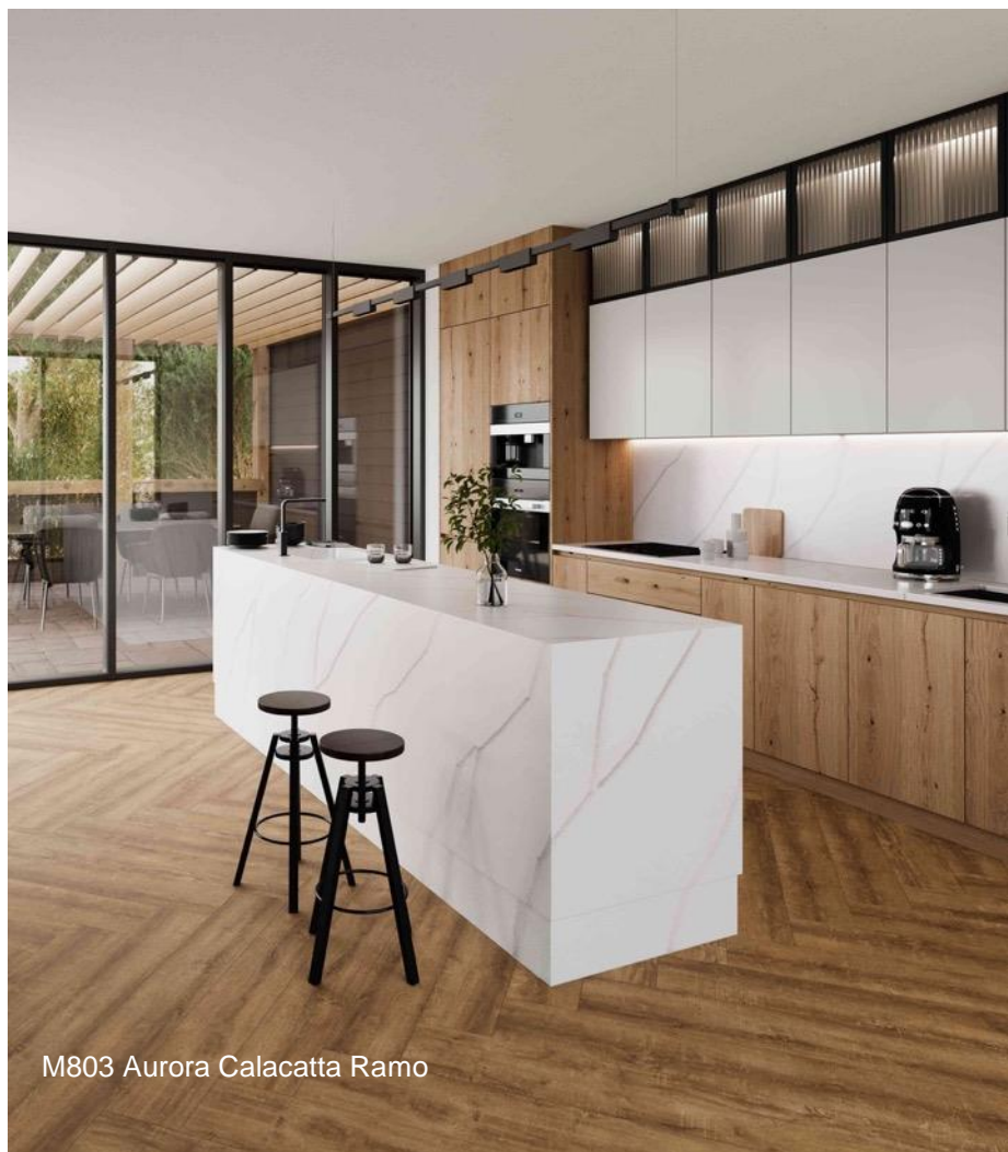
M803 Aurora Calacatta Ramo

Aurora Calacatta Ramo allie élégance et modernité, s'inspirant de la beauté naturelle du marbre Calacatta associé à des veines marron chaudes sur une base blanche. Avec son aspect organique, ce coloris est idéal pour les grandes surfaces telles que les banques d'accueil, les revêtements d'îlots, les plans de travail et les murs et sols de salles de bains.