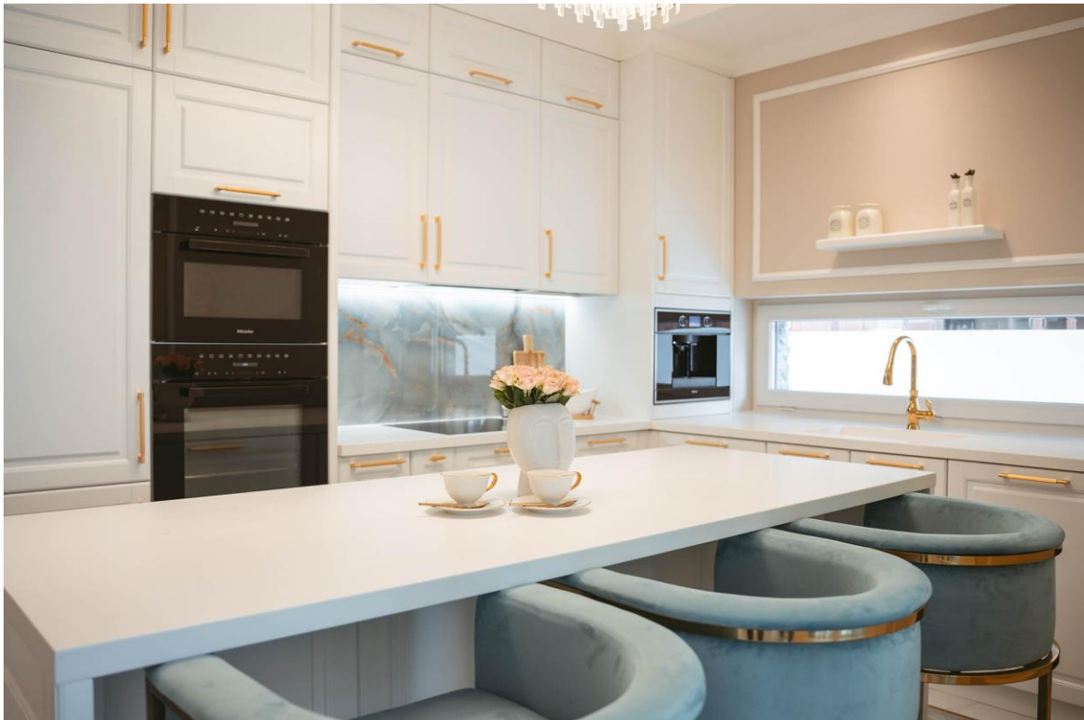
Classic Glam Kitchen

Ubicación: Oradea, Rumania - Diseño: Raluca Birta, Nicolae Mateas - Saramob Design - Fabricación: Saramob Design - Proveedor de HIMACS: Atvanguard Romania - Material: HIMACS S028 Alpine White