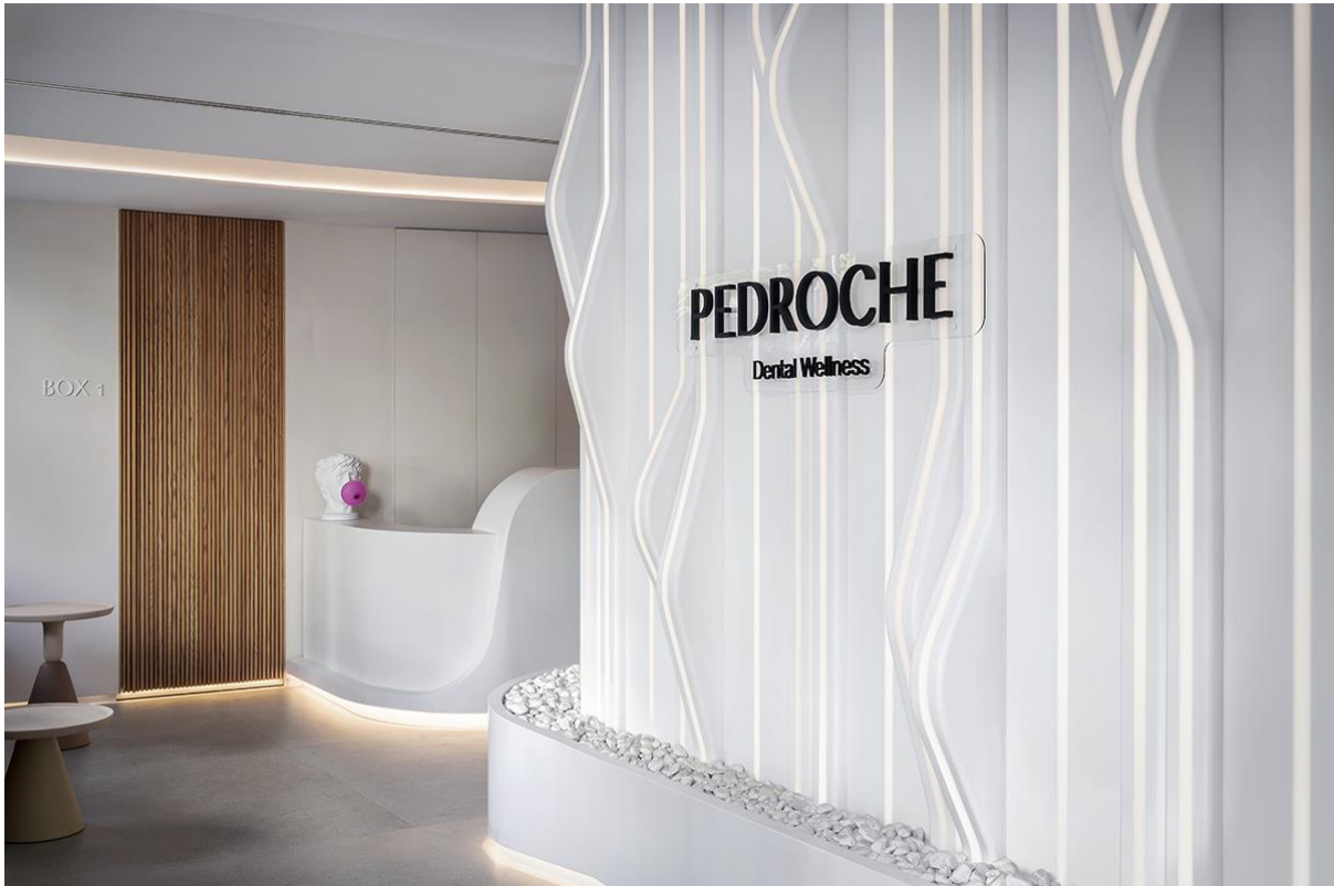
Clínica Dental Pedroche

Ubicación: Madrid, España - Diseño: Yolanda Segade - Segadestudio arquitectura interior - Fabricación: AR Superficies Sólidas - Proveedor de HIMACS: AR Superficies Sólidas - Material: HIMACS S028 Alpine White