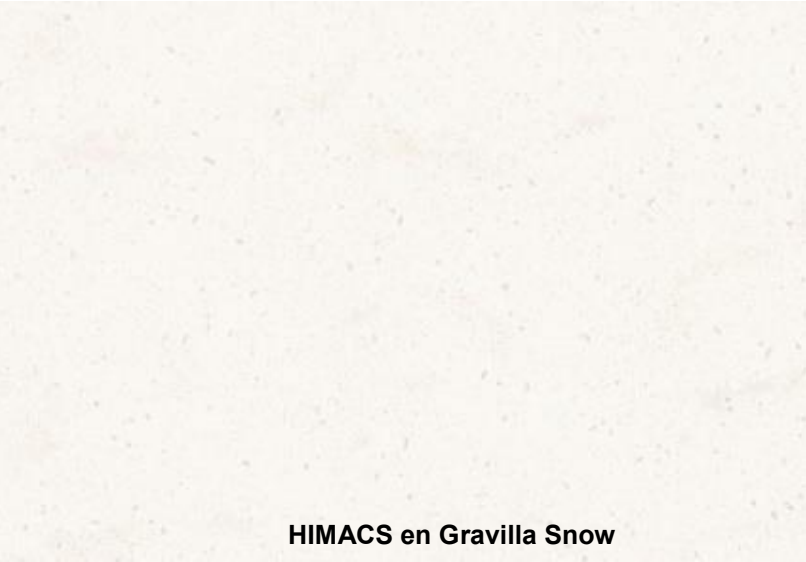
HIMACS en Gravilla Snow

Gravilla Cream tiene un toque de color más intenso, con partículas atenuadas, y es perfecto para añadir profundidad y calidez a decoraciones más frías. También es ideal para islas de cocina, superficies de trabajo, revestimientos de baño y encimeras, gracias a que combina y complementa cualquier estilo decorativo con su acabado sosegado. Esta superficie de tonos cálidos también proporciona un aspecto sereno y elegante a oficinas, hoteles e interiores comerciales, pues proporciona una estética de alta calidad para zonas de recepción, espacios diáfanos y despachos.