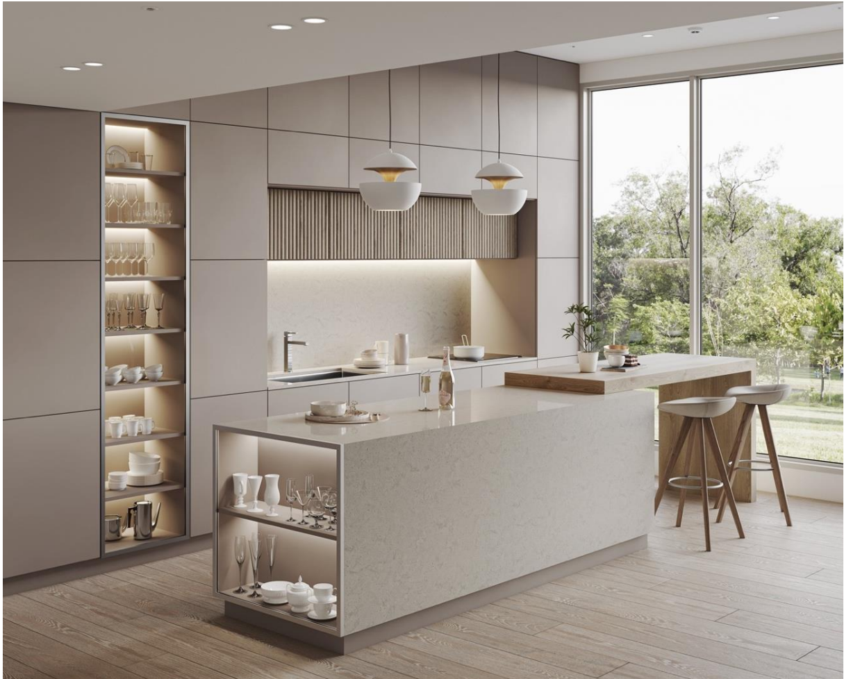
HIMACS en Gravilla Cream

Así, las nuevas incorporaciones al amplio abanico de producto de HIMACS incluyen dos nuevos colores para la nueva colección Gravilla , y otras dos tonalidades, también totalmente inéditas, para la popular serie Aurora & Marmo . Estos cuatro nuevos tonos presentan, al igual que el resto de las gamas y colores ya existentes en HIMACS, las características y propiedades de esta piedra acrílica.