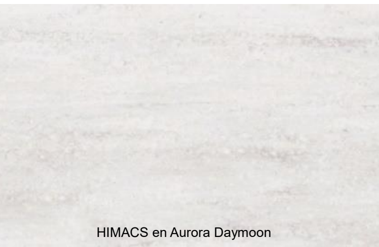
HIMACS en Aurora Daymoon

Aurora Daymoon , con su base en gris claro, presenta una capa de suaves vetas y grandes partículas que evocan el aspecto de la superficie lunar al amanecer. Este tono combina a la perfección con mobiliario de madera oscura y diseños industriales, y contribuye a crear una sensación de amplitud. También provoca un llamativo efecto cuando se produce en grandes bloques para mesas de oficina y salas de reuniones, aunando así un acabado en tendencia y profesional.