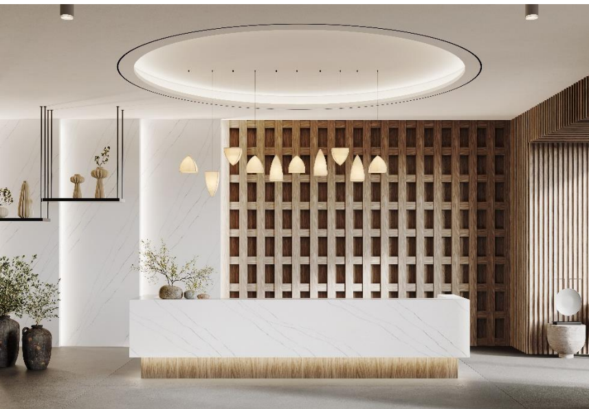
HIMACS en Aurora Calacatta Fiore

Si se necesita un efecto marmóreo característico, Aurora Calacatta Fiore es la elección perfecta por sus vetas largas y fluidas y su tono blanco cálido. Sencillo y lujoso, combina a la perfección con armarios de cocina en mate, muebles de estilo Shaker y acabados de madera natural. Así, constituye una alternativa de poco mantenimiento y totalmente reparable al mármol auténtico, con un mismo aspecto y tacto de gama alta, pero más fácil de cuidar, fabricar e instalar en un acabado pulido e higiénico.